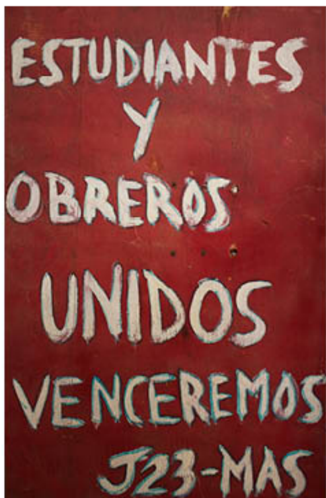
JUVENTUD 23 (Puerto Rico) Untitled , 2011 Acrylic on wooden shield, 36" x 24"